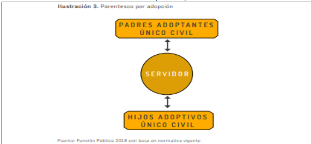
Imagen 3 función pública 2018

Los representantes legales, los apoderados y en general, los directivos y trabajadores de ETB S.A. ESP , así como los proponentes, contratistas, proveedores, aliados y toda persona que labore o preste sus servicios a estos, deberán abstenerse de participar, por sí o por interpuesta persona, en interés personal o de terceros, en actividades de contratación de ETB S.A. ESP que impliquen un posible conflicto de interés.